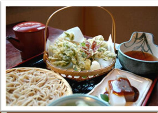
深大寺そば (※写真はイメージです)