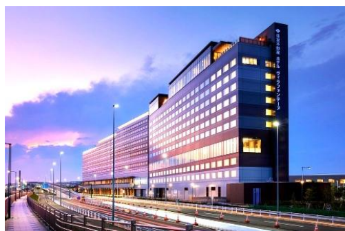
羽田エアポートガーデン

8:00 八千代町 ～ 羽田エアポートガーデン ～ ホテル雅叙園東京(昼食・見学)・目黒川の桜(見学) ～ 19:15 八千代町