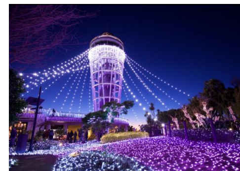
江の島イルミネーション