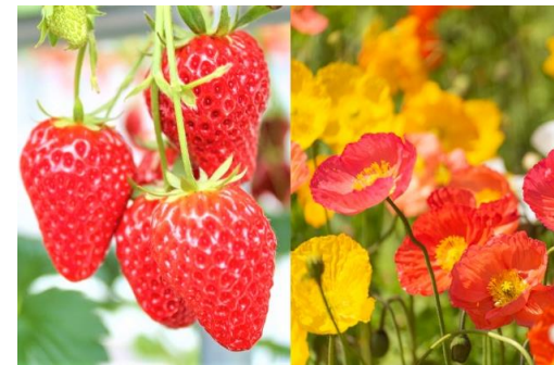
磯山観光いちご園