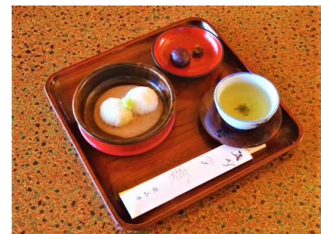
くるみおはぎ (前山寺)